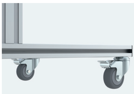
rígido con ruedas giratorias