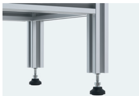
rígida, con pies regulables