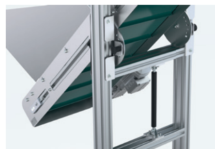
altura e inclinación ajustables