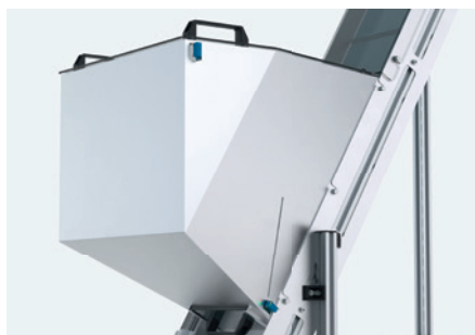
tolva-depósito con sensores de nivel de llenado