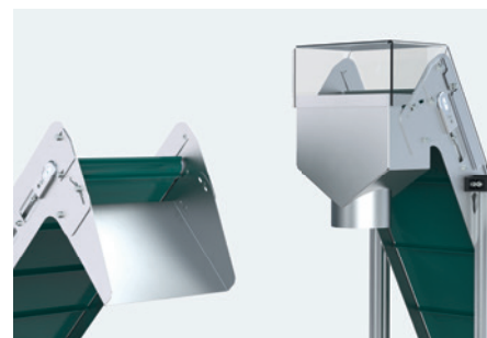
rampa de descarga, tolva de descarga, tapa