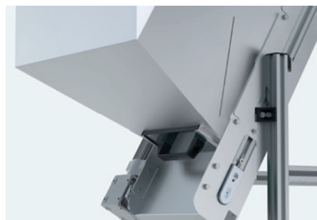
abertura de descarga con bloqueador e indicador de nivel de llenado óptico